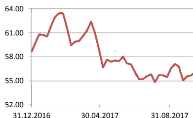
Performance 01.01.2017 bis 13.10.2017